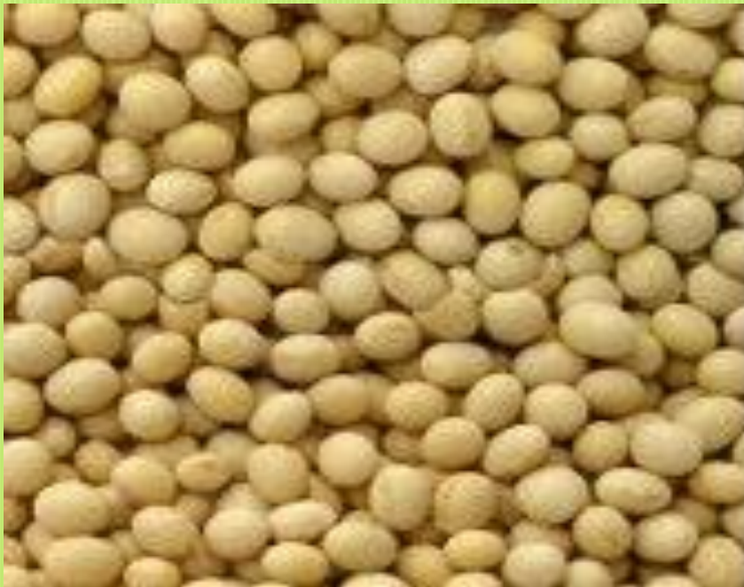
Semi di soia

Il pannello deriva dalla spremitura meccanica dei semi di soia